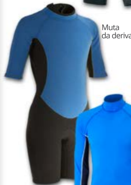
Muta da deriva