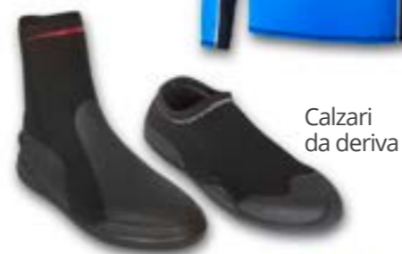
Calzari da deriva