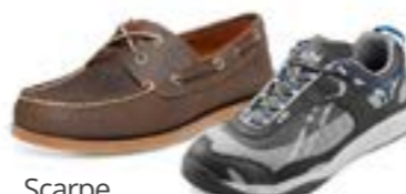
Scarpe da barca